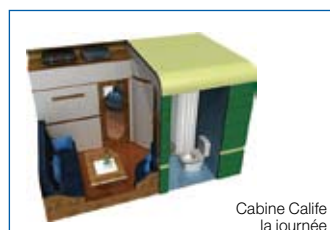
Cabine Calife la journée