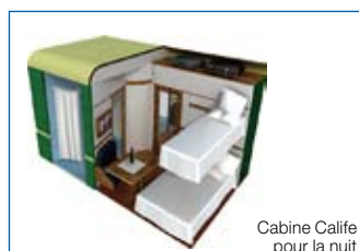
Cabine Calife pour la nuit