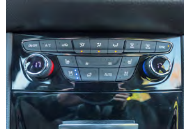
Mittelkonsole Sie wird durch zu viele Schalter bevölkert.

Im Verkehr zeigt sich der Kompakte von Opel als sehr agil und wendig, was im Stadtverkehr sehr vorteilhaft ist. Das Fahrwerk ist straff und der 1,6-Liter-Dieselmotor mit 136 PS Leistung erlaubt eine recht sportliche Fahrweise. Die Schaltung – welche mit etwas kürzeren Schaltwegen noch besser wäre – und die präzise Lenkung passen gut zum Astra. Er schafft es in 9 Sekunden von 0 auf 100 km/h und zeigt sich auch im Verbrauch moderat. Im Test verbrannte der Astra 5,3 Liter Diesel auf 100 Kilometer. Auch auf der Langstrecke macht der neue Astra eine gute Figur und