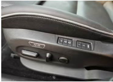
Komfort Der Fahrersitz lässt sich in alle Richtungen verstellen.