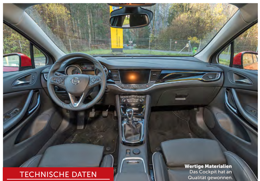
Wertige Materialien Das Cockpit hat an Qualität gewonnen.