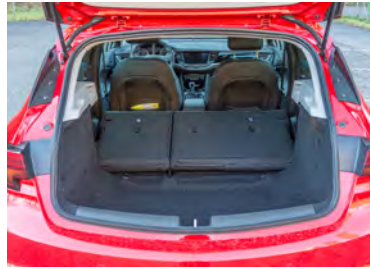
Kofferraum Die hohe Ladekante ist nicht optimal.