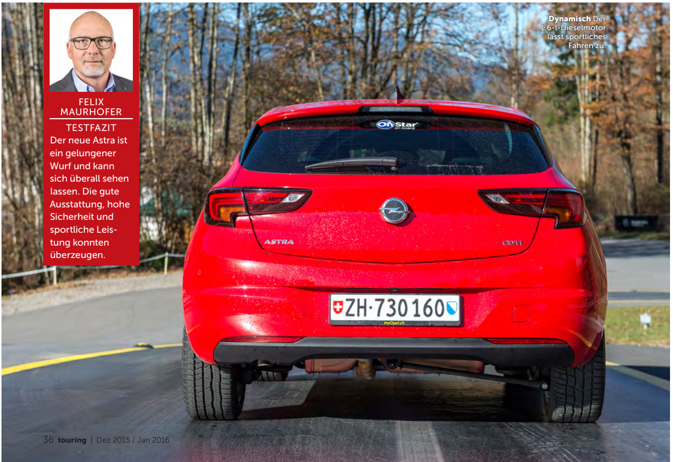
Dynamisch Der 1,6-L-Dieselmotor lässt sportliches Fahren zu.

Der neue Astra ist ein gelungener Wurf und kann sich überall sehen lassen. Die gute Ausstattung, hohe Sicherheit und sportliche Leistung konnten überzeugen.