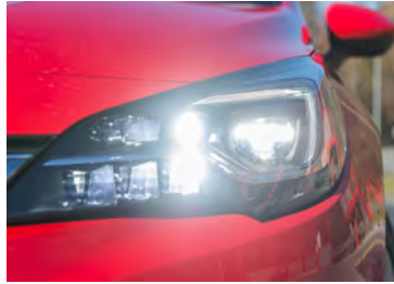
Es werde Licht 16 LED steuern das innovative Matrix-Lichtsystem.

Die Karosserie des neuen Astra ist schick und vermittelt einen Hauch von Sportlichkeit. Ein Auto, das sich rundum gut präsentiert. Die Sicht nach vorne und auf die Seiten ist ordentlich. Beim Rückwärtsfahren ist sie eingeschränkt und