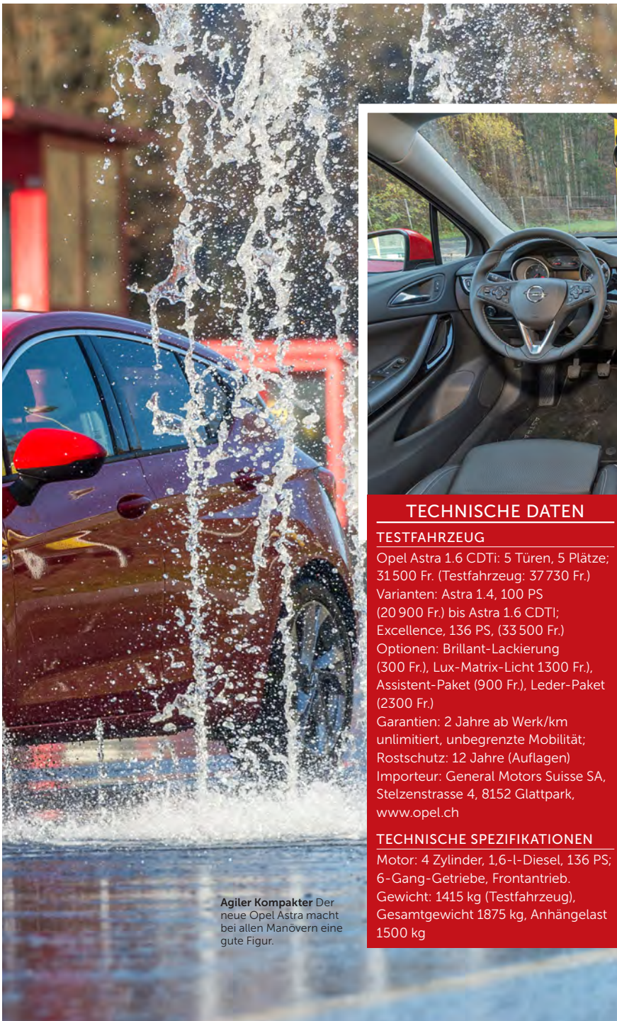
Agiler Kompakter Der neue Opel Astra macht bei allen Manövern eine gute Figur.

D er neue Opel Astra ist Sinnbild dafür, dass die Kompaktklasse immer häufiger mit Premium-Assistenzsystemen ausgerüstet wird. Der von uns getestete Astra 1.6 CDTI in der Ausführung Excellence hat neben diversen serienmässigen Helferchen wie Keyless-Entry, Licht- und Regensensor, Hill-Holder oder Kollisionswarner zudem das optionale Matrix-Lichtsystem installiert. Das aus 16 Elementen bestehende LED-Lichtsystem ermöglicht das Fahren ausserhalb der Stadt mit permanent blendfreiem Fernlicht. Es passt je nach Situation automa-